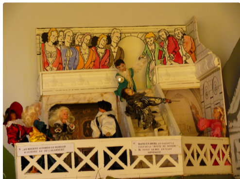
Le Régent autorise le mariage d'Aurore et Lagardère. Dans un duel en faisant le coup de la "Botte de Nevers" il venge le Duc en tuant Gonzague.