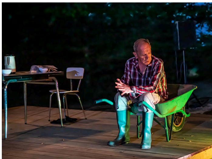
"Droit dans mes bottes"

. à 21 heures : Droit dans mes bottes de Marie Delmarès par la Compagnie Les Attracteurs étranges ; dans leur ferme familiale, un père et sa fille s'affrontent : le père pense croissance, pesticides et profit ; sa fille pense solidarité et environnement ; d'où conflit de générations, et difficulté à communiquer : « une pièce sensible et émouvante ».