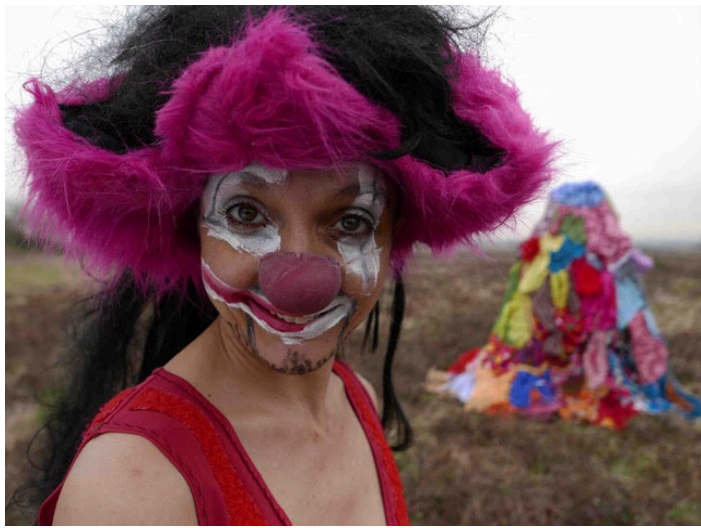
"Ni tout-à-fait la même"