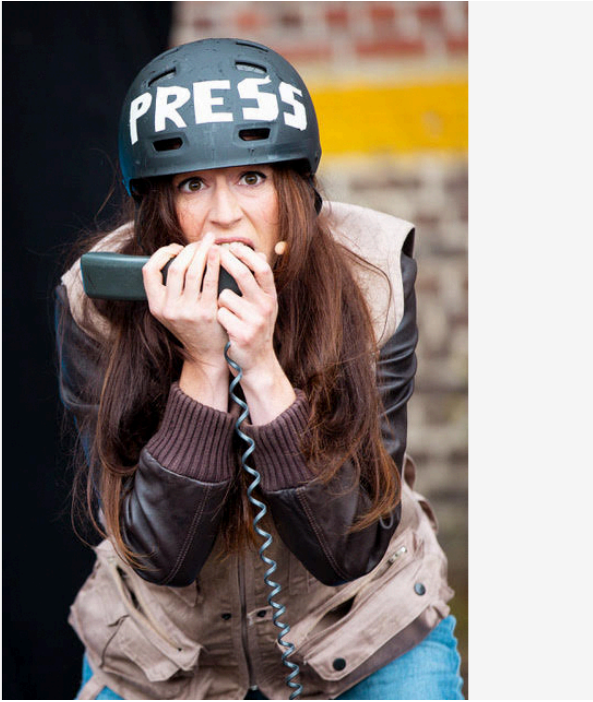
"Madame, Monsieur, Bonsoir !"

. à 21 heures : Madame, Monsieur, Bonsoir par la Compagnie AIAA ; la moitié des Français ne font pas confiance aux médias français et pensent qu'ils sont semés de pièges ; la pièce pousse les situations dans leurs retranchements absurdes ;