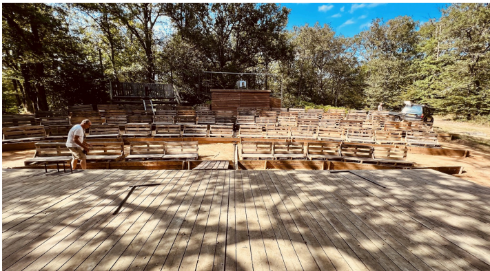
" La salle de spectacle" vue de la scène en 2023

La « salle » de spectacle est une clairière avec des bancs confortables, aménagée dans le Domaine des mille chênes, pour former un amphithéâtre au pied d'un grand chêne. Il y règne une fraîcheur agréable en été.