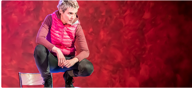
Du théâtre en pleine forêt avec Les Moissons d'Été à Termes-d'Armagnac

Pour la 8e année, la Compagnie Les Attracteurs étranges (1) propose au public gersois de rencontrer des comédiens professionnels avant et après qu'ils ont présenté leurs spectacles des Moissons d'été, du 6 au 10 août 2024. Spectacles variés, que l'on peut voir à raison de deux chaque soir, à 18 heures et à 21 heures.