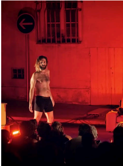
3 Danser dans mon petit salon...

. à 21 heures : Danser dans mon petit salon sans me poser de questions par la Compagnie Muerto Coco ; « Le plus naïvement possible, je me lance dans une investigation sur le concept de virilité. En conversant autour de moi, en collectant des paroles, en écrivant, en lisant, en bougeant mon corps dans des culottes en dentelle, en satinette, en ouatine, pour hommes bien sûr. Ça va prendre la forme d'un poème fleuve en patchwork, ça va être une pensée qui se trouve en avançant mathématiquement, ça va se demander ce qu'on fait des mots encombrants, ça va finir en comédie musicale grandiose ».