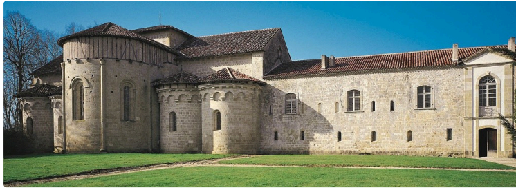
Les Douces Heures Estivales 2024

Pour sa 9 ème édition, le festival Les Douces Heures Estivales vous donne rendez-vous