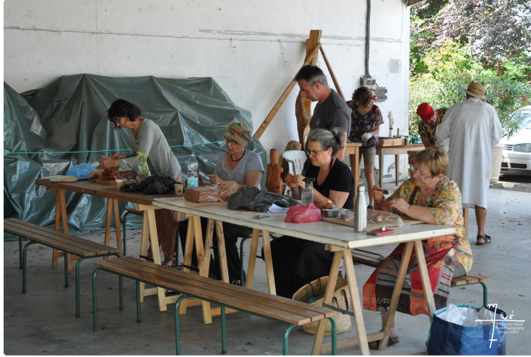
Avoz'art : des stages gratuits de modelage et de sculpture !

Le festival Avoz'art de Mourède propose une magnifique exposition dans l'église et sur la place jusqu'au 18 août mais aussi deux week-end de stages gratuits.