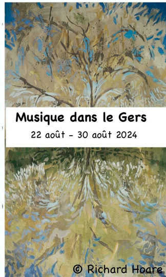
Quand la musique de chambre rencontre le terroir occitan

Depuis sa création en 2015, le festival "Musique dans le Gers" s'est imposé comme un rendez-vous incontournable pour les amateurs de musique de chambre en France. Niché dans le cadre bucolique de la région gersoise, ce festival unique en son genre réunit des musiciens venus des quatre coins du monde, avec une mission claire : favoriser l'apprentissage, la créativité, et la camaraderie musicale.