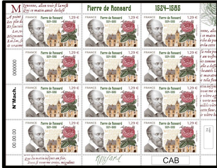
Pierre de Ronsard : anniversaire de sa naissance.