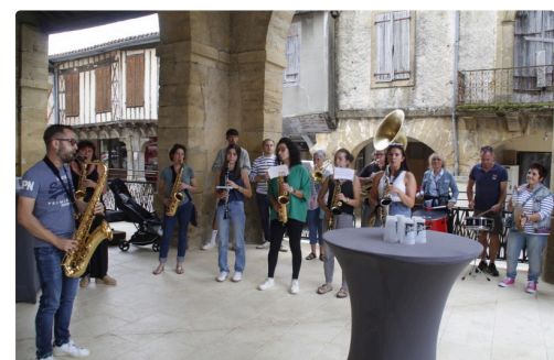
Miélan 15082024 (35).JPG