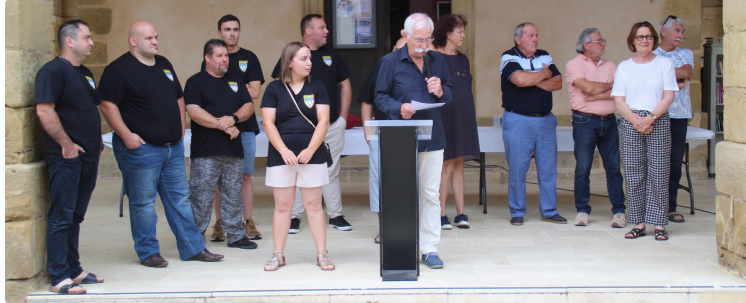
Les fêtes de Miélan sont ouvertes

Tout commence par un discours, une remise symbolique des clés de la ville, un apéritif offert par la municipalité puis un repas de rue à La Calèche et un concours de pétanque.