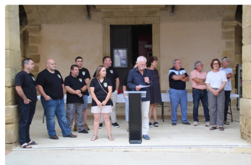
Miélan 15082024 (21).JPG

23H Bal disco avec le podium Adishatz, invité par le comité des fêtes.