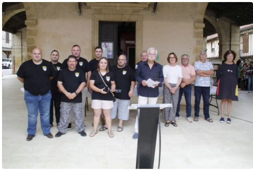
Miélan 15082024 (34).JPG