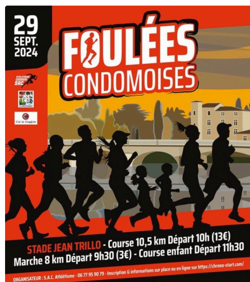
00000 condom foulées.jpg