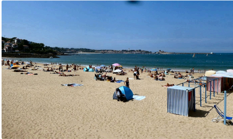
Escapade à Saint Jean de Luz avec le Centre Ressources Val de Gers

Organisé par le Centre ressources Val de Gers, la sortie vers l'Océan avait fait le plein, permettant à 52 personnes de toutes les générations de découvrir la charmante ville de St Jean de Luz, ce qui pour certaines a constitué la seule évasion de l'été.