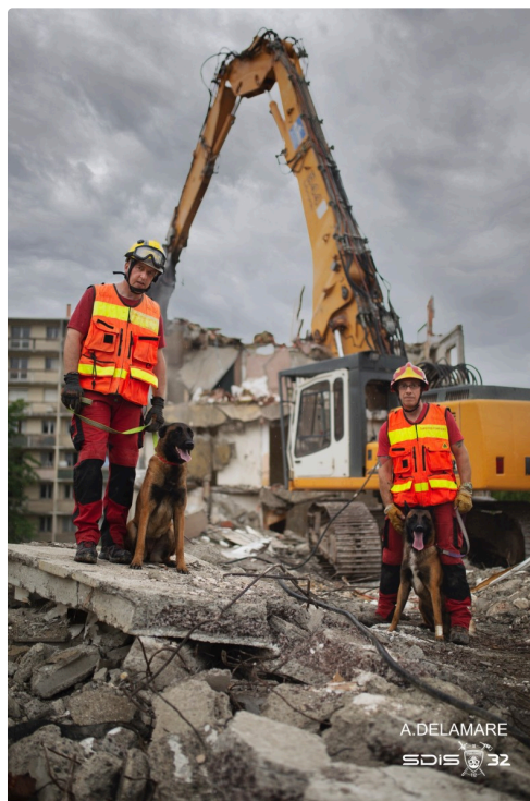
pompiers chiens 3.jpg