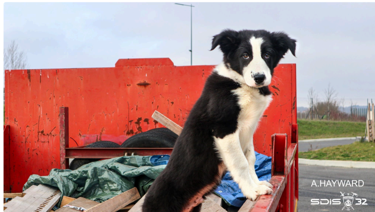
Journée du chien

Le meilleur ami de l'Homme est aussi celui du sapeur-pompier !