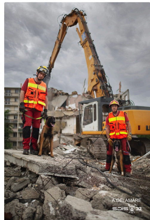
pompiers chiens 3.jpg