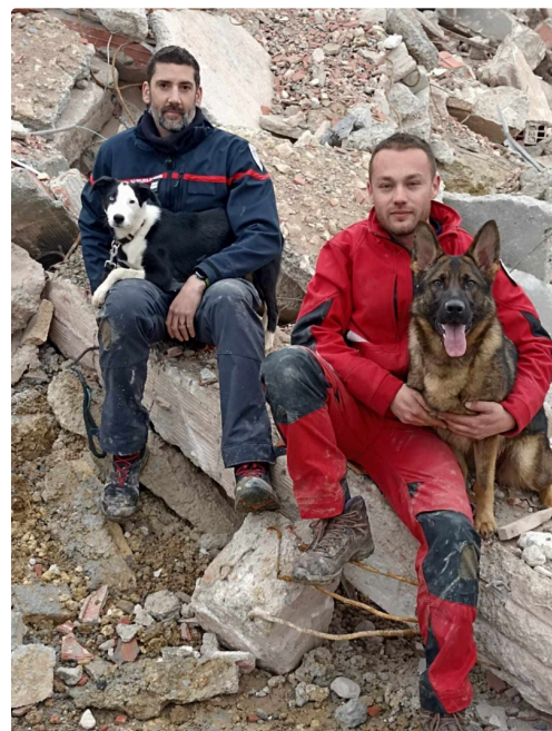
pompiers chiens 1.jpg