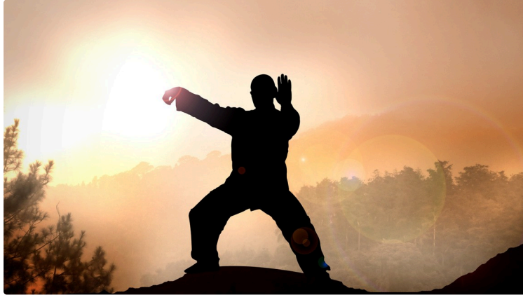
Séances Qi Gong et ateliers prévention mémoire organisés par les associations ADMR

Dans le cadre des actions de prévention financées par le Département du Gers et la Conférence des Financeurs, deux associations ADMR du Gers organisent des ateliers prévention gratuits.