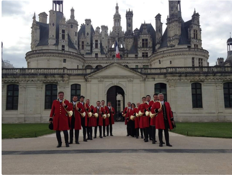
Journées européennes du patrimoine : concert de prestige avec chants basques et trompes de chasse

Dimanche 22 septembre à 17 heures à l'église, en clôture des Journées européennes du patrimoine, après avoir visité la bastide au clocher tors, et son patrimoine, prolongez votre soirée avec le rendez-vous musical proposé par L' Association Arts et musique en barrannais qui a invité les sonneurs du Rallye deux étangs et leurs 14 choristes, avec sonneries et chants basques au programme.