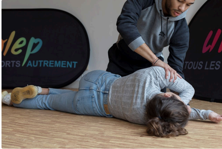
UFOLEP : proposition de formation gratuite aux premiers secours

A l'occasion de la journée mondiale du secourisme samedi 14 septembre, le comité départemental UFOLEP du Gers vous indique son planning de formation premiers secours à destination des publics séniors pour cette fin d'année.