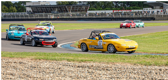
Maxi 2L Classic +Maxi 1300 Séries course 2 : Maurice n°17 en tête