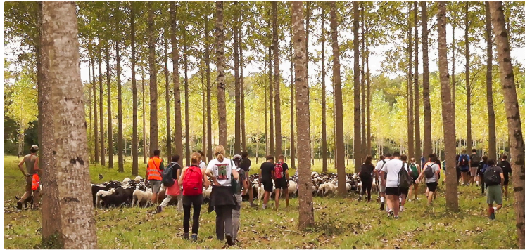
Le troupeau Iriberry en transhumance arrive le 18 septembre dans le Gers

Il traverse 8 villages du Gers, dont Perchède et Toujouse