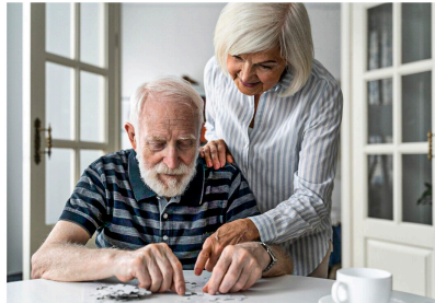
Journée Alzheimer le 03.10.2024 à l'hôpital de Nogaro : l'occasion d'en savoir plus sur la recherche et de faire un don

Randonnées, apéritif à l'hôpital et repas au circuit