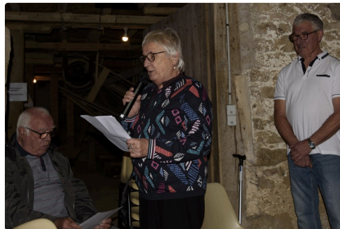
Soirée moulin 21092024 (2).jpg