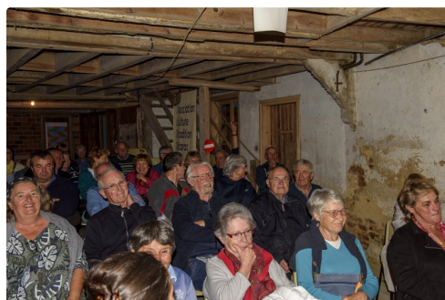
Soirée moulin 21092024 (4).jpg