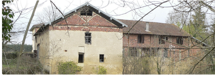
Soirée au moulin