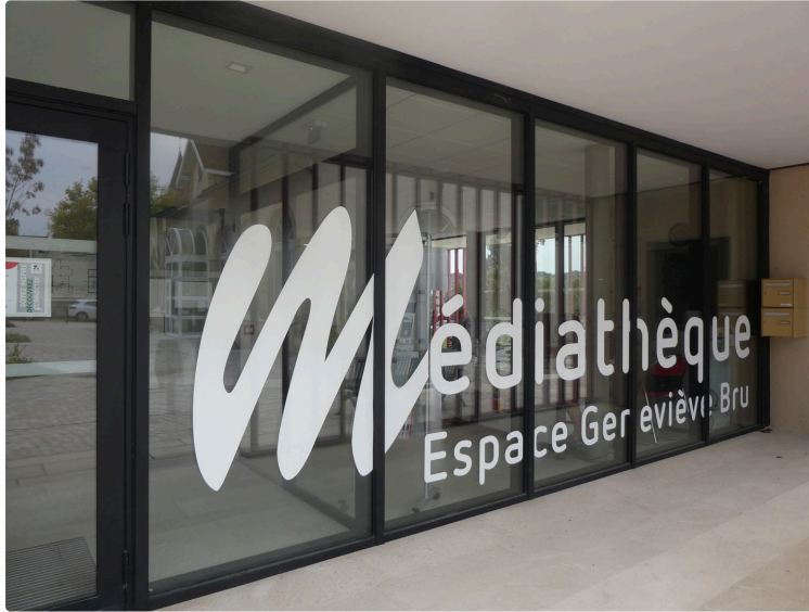
Le mois d'octobre à la Médiathèque