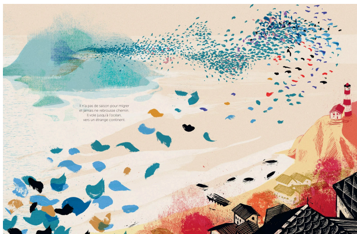
Album "Oiseau bleu", Heyna Bé