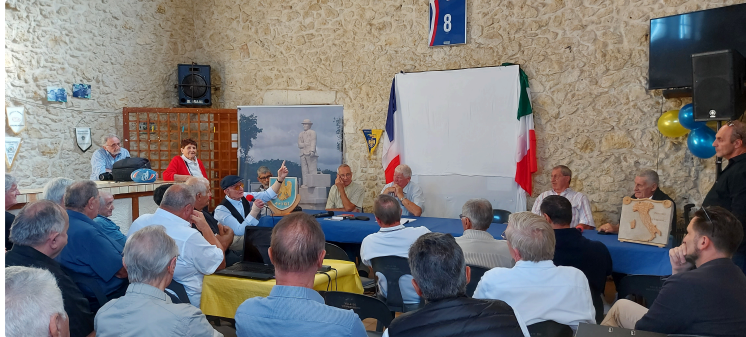
Rugbitalia 2e édition : le match retour aura bien lieu !