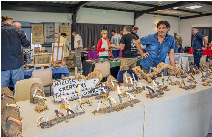
Un stand à l'expo d'octobre 2023