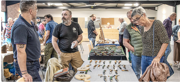
Nouvelle exposition de couteaux et de bâtons d'art à Nogaro

Couteaux de travail, couteaux de collection