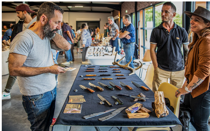
Stand à l'expo d'octobre 2023