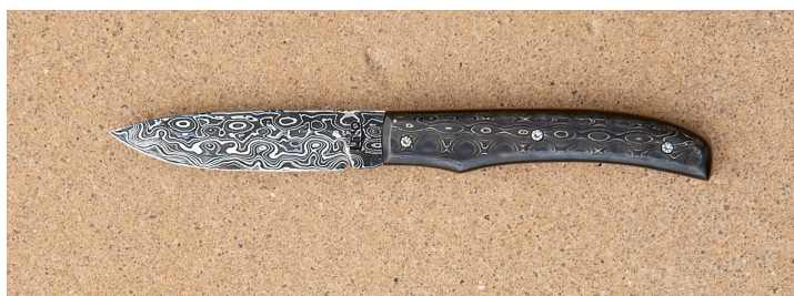
Couteau à lame damassée

Les lames sont forgées dans des aciers soit inoxydables, soit carbonés. Les lames sont fixes ou pliantes. Certaines sont damassées : ce sont de rares œuvres d'art. Forgées dans un acier particulièrement riche en carbone, elles présentent de superbes motifs moirés, créés par la cristallisation du métal. Une lame damassée est le résultat d'une composition de plusieurs couches d'aciers différents qui sont ensuite forgés ensemble pour donner une lame parfaitement homogène.