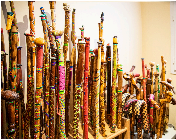
Autres bâtons de Maurice Jurquet