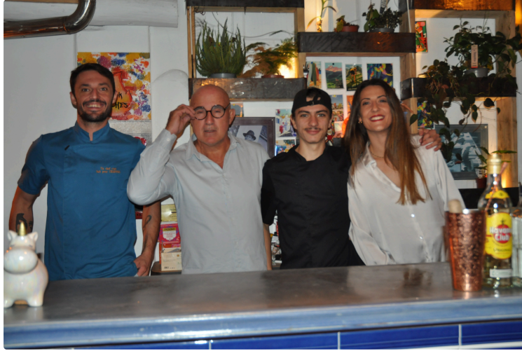
Quand "Lo Potz" s'exporte en Belgique !

Le restaurant « Lo Potz », que les Vicois connaissent bien, sera fermé du 4 au 7 octobre mais ouvert à Liège en Belgique à la même période.