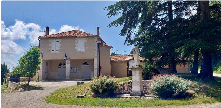
Repas et rugby à Rozès samedi !

Le comité des fêtes de Rozès organise un repas gigot à la ficelle