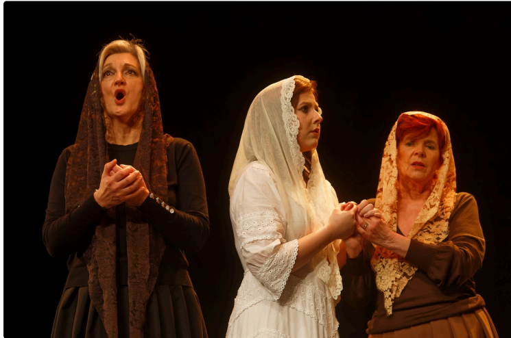
Une plongée inédite dans La Traviata avec le spectacle "BRINDISI"

Verdi comme vous ne l'avez jamais entendu.