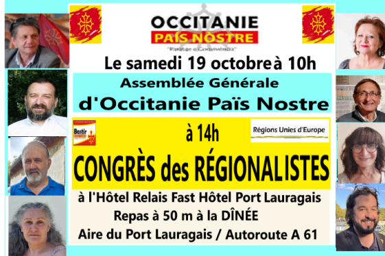
Congrès régionaliste à Port Lauragais

Dix prises de paroles avec des régionalistes, des représentants des groupes citoyens, écologistes.