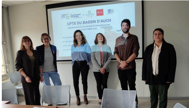
Un accord conventionnel Interprofessionnel signé entre la CPAM et la CPTS Bassin d'Auch

C'est le 4 ème dans le Gers (CPTS : Communauté Professionnelle Territoriale de Santé)