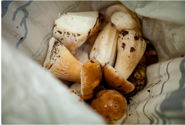
La cueillette des champignons, oui, mais avec modération et quelques précautions !

L'automne est là et la cueillette des champignons, seul ou en famille, va reprendre de plus belle. Cette activité attire de plus en plus d'amateurs et de curieux en tout genre. Certains reviennent le panier plein, d'autres les mains vides.