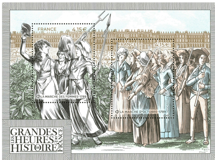
La marche des femmes à Versailles, 5 octobre 1789

Le 12 novembre 2024, La Poste émet un bloc de la série les Grandes Heures de l'Histoire de France, illustré par deux timbres sur la marche des femmes à Versailles le 5 octobre 1789 qui précipita la fin du règne de Louis XVI.