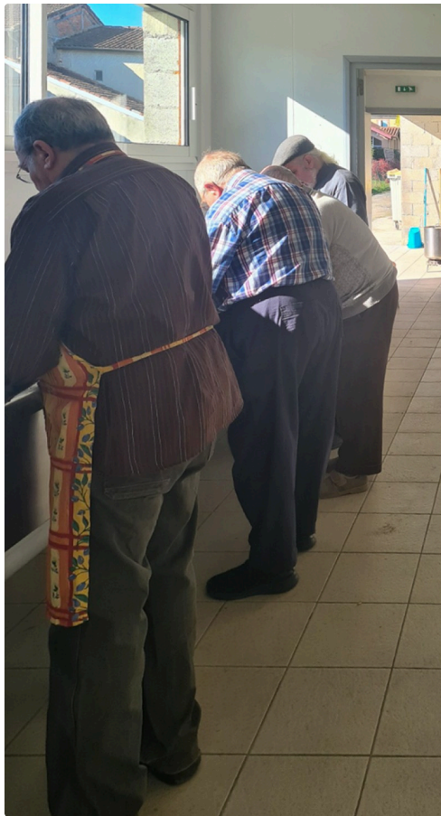
les 4 mousquetaires.jpg