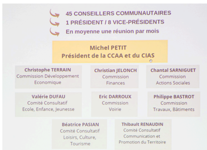
Organisation de la CCAA (document projeté le 24.10.2024)