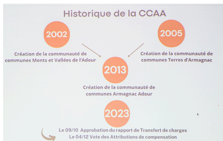
Document projeté le 24.10.2024