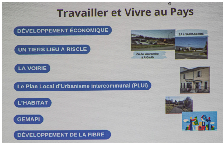
Travailler et vivre au pays (document projeté le 24.10.2024)

Et enfin « le Budget » qui est expliqué en détail (2).