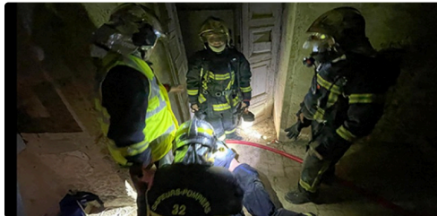
isle de noe pompiers manoeuvre 1.jpg