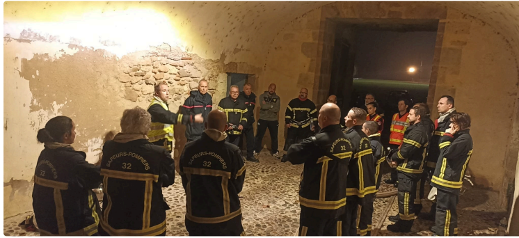
Une manœuvre inter-centres au château de l'isle-de-noé