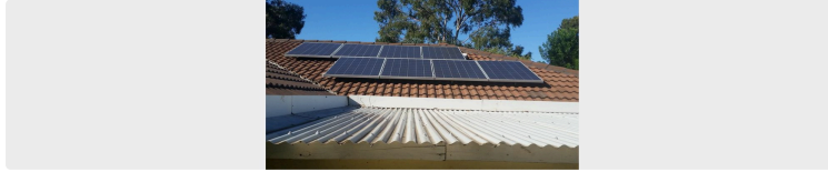
Réunion publique « Énergie citoyenne photovoltaïque » à Nogaro

L'association Pimao veut contribuer à lever la méfiance sur l'énergie solaire en partageant des infos vérifiées