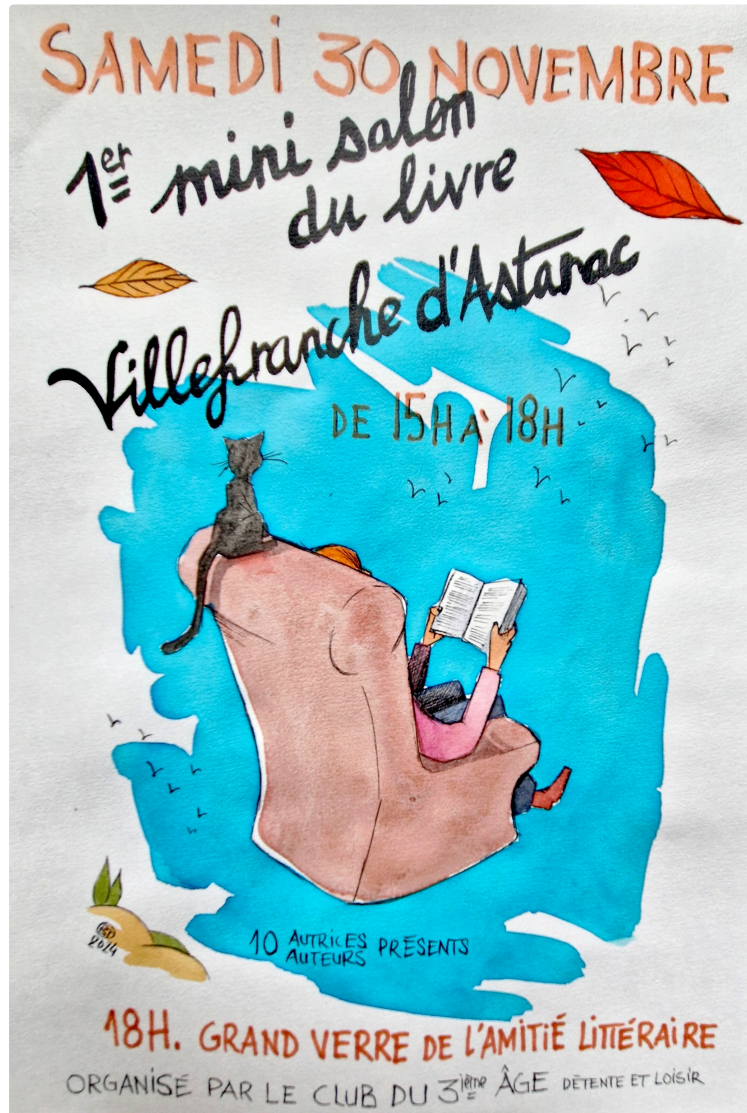
Mini salon du livre d'auteurs locaux à Villefranche-d'Astarac

Samedi 30 novembre de 15 h à 18 h dans la salle culturelle du Préau , le premier mini salon du livre d'auteurs locaux à Villefranche-d'Astarac réunira 10 écrivains, sous l'égide du club du 3e âge Détente et Loisirs . Cette aventure inédite offrira une belle palette de découvertes. Terroir, romans, poésie, ouvrages scientifiques. Un après-midi culturel et chaleureux, hors les écrans, qui se terminera par le grand verre de l'amitié littéraire.