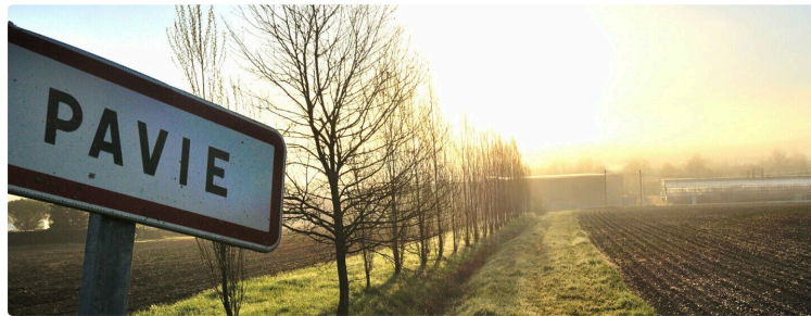
Avec envie nous irons à Pavie

Nous irons promener Mardi prochain 12 novembre 2024.