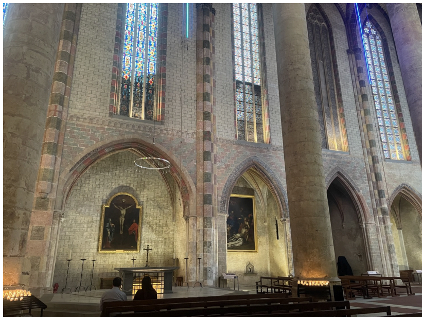
Intérieur de l'église

Cet édifice gothique, au cœur de Toulouse, se distingue par son église, nommée Saint Thomas d'Aquin en l'honneur du théologien du XIII e siècle, ainsi que par son cloître offrant aux visiteurs un aperçu de l'art médiéval méridional.