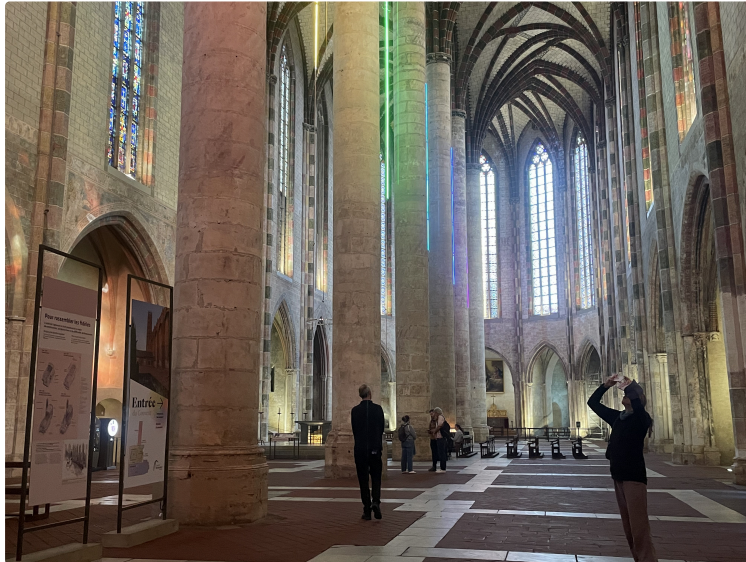
Nouveau : la chronique touristique de Neyla !

Cette semaine, le Couvent des Jacobins et l'Abbaye de Flaran