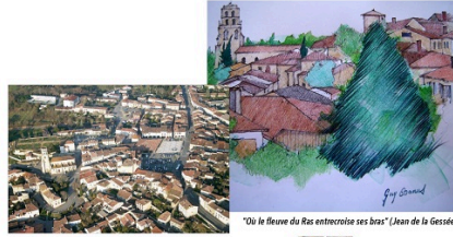
"Où le fleuve du Ras entrecroise ses bras" (Jean de la Gessède)

Le Protestantisme en fait au XVIème siècle une de ses "places de sûreté", dans des guerres fratricides. Après la Révolution, c'est un chef-lieu de canton rural, où la République mettra longtemps à s'imposer. Notre XXème siècle enfin sera celui des deux guerres mondiales, la "saignée" de la première, l'occupation et la Résistance de la seconde. Depuis 1950, la "révolution silencieuse" bouleverse ses campagnes et son bourg-centre. De nombreux encarts pour faire vivre notre histoire par ses témoins.