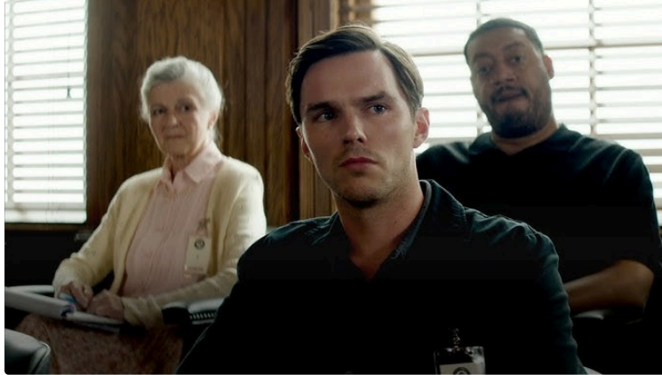
Cinequanon : programmation de la semaine