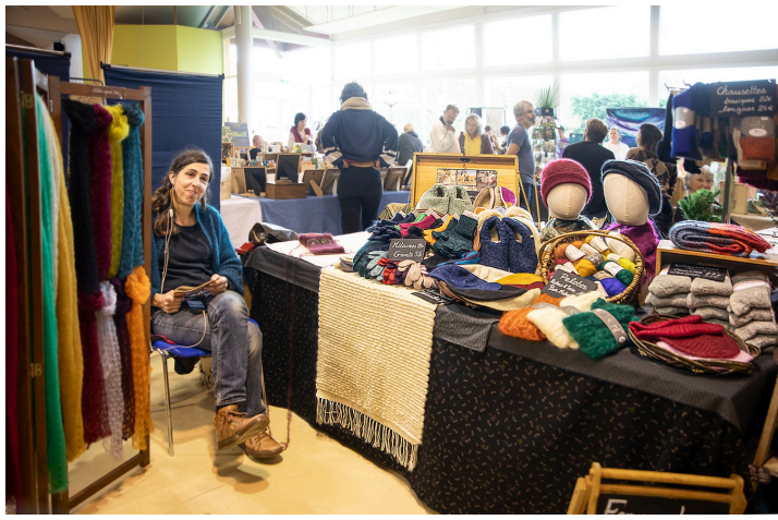
Chaussons, bérets et mitaines