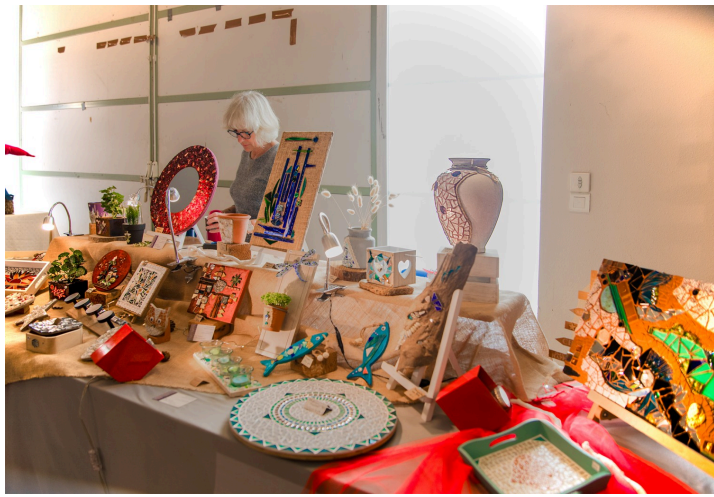
Objets de décoration