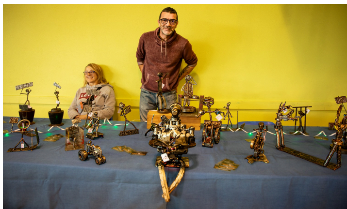
Sculpteur sur métal