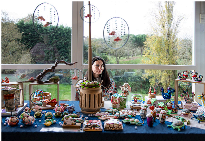
Tout petits personnages et animaux