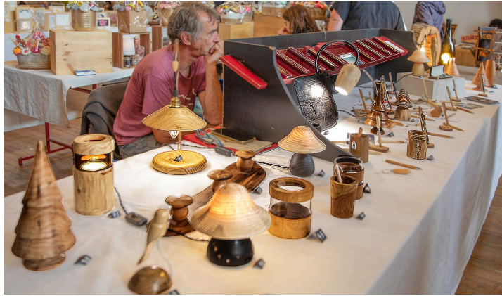
Autres objets de décoration