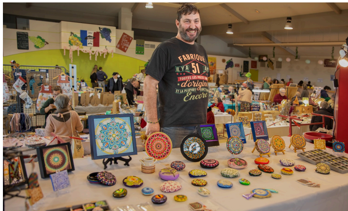
Objets peints (et le t-shirt vaut 2 min d'attention...)