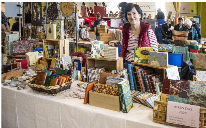
Toutes sortes d'agendas faits main