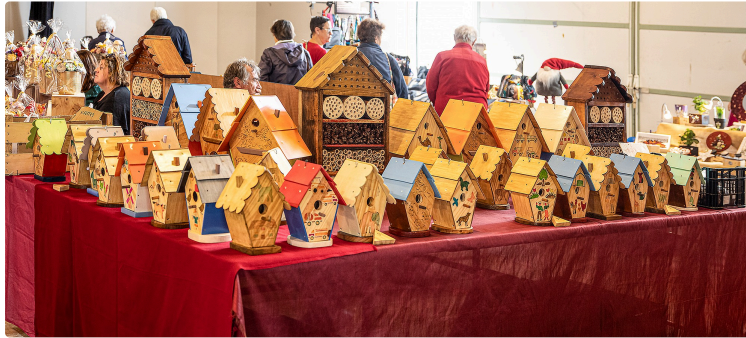
Le Petit marché d'artistes et d'artisans d'art d'Aignan : un succès !

Des exposants d'une grande variété de talents