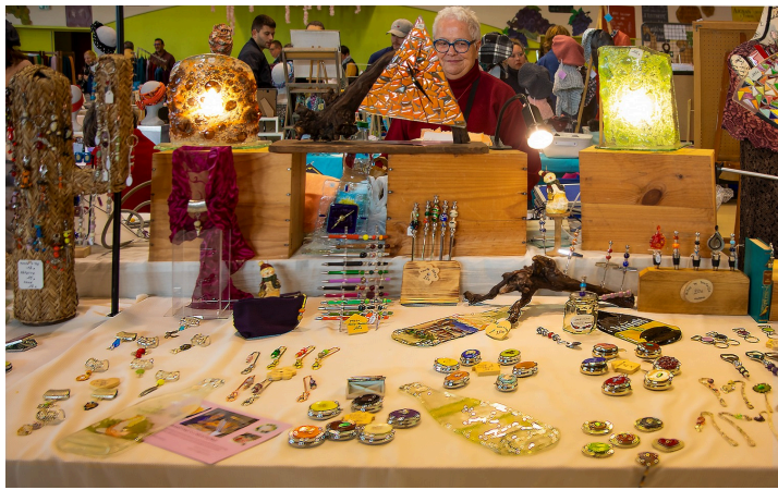
Objets de décoration