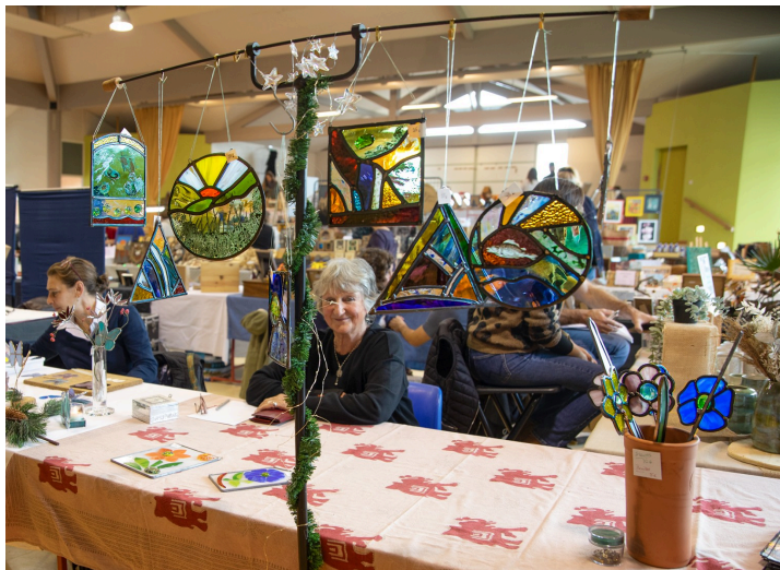
Fleurs et dessins transparents