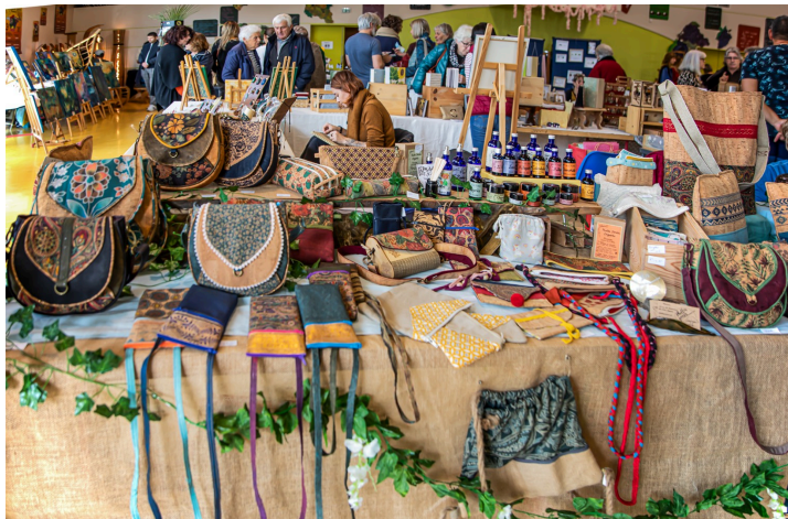
Sacs et sacoches