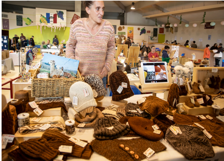
Bonnets et gants de laine