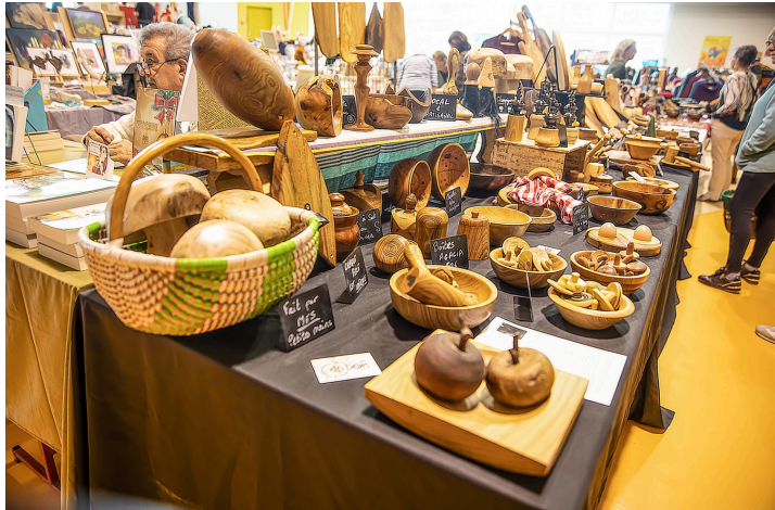
Objets en bois