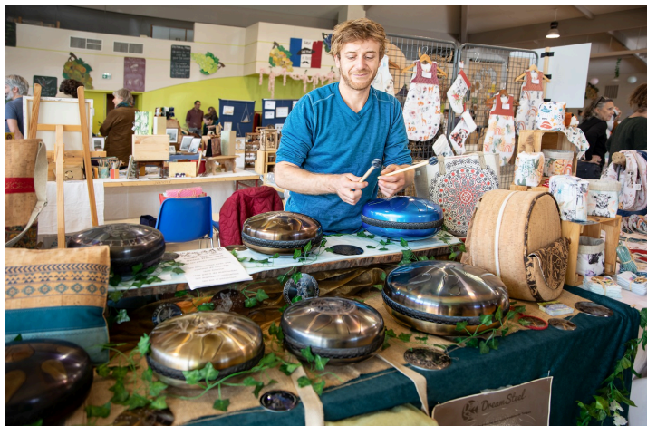
Fabricant de tongues (tambours de métal décoré et gravé)