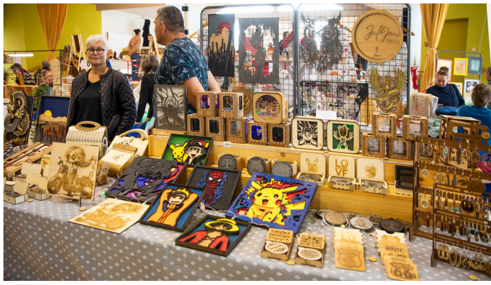
Divers types de dessins