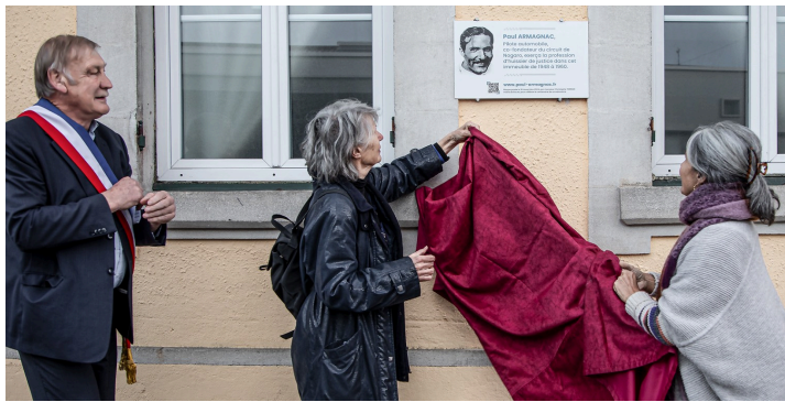
Ça y est, c'est réussi