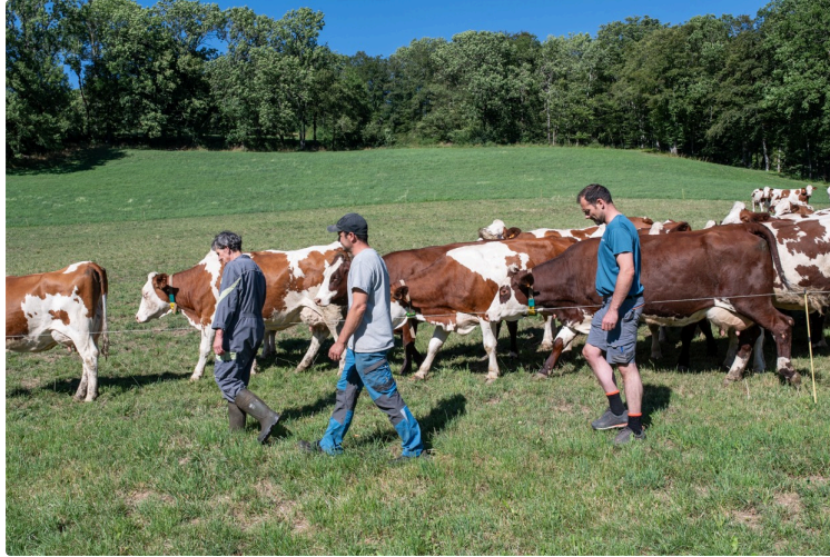
Cinequanon : programmation de la semaine et un cine-débat autour de la ruralité vendredi