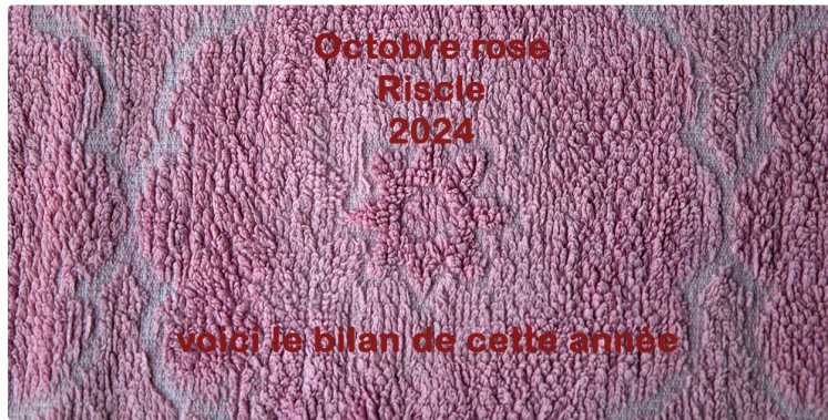
Octobre Rose à Riscle, bilan de cette année