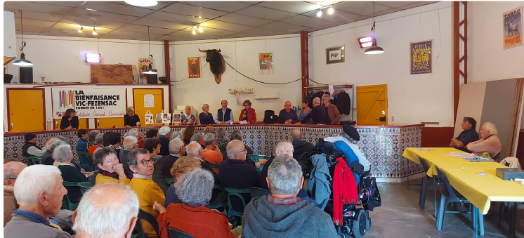
La Bienfaisance : une association historique toujours très active de 242 adhérents