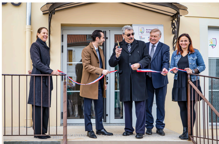
Le ruban est coupé !

L'emménagement a lieu le 2 septembre 2024.