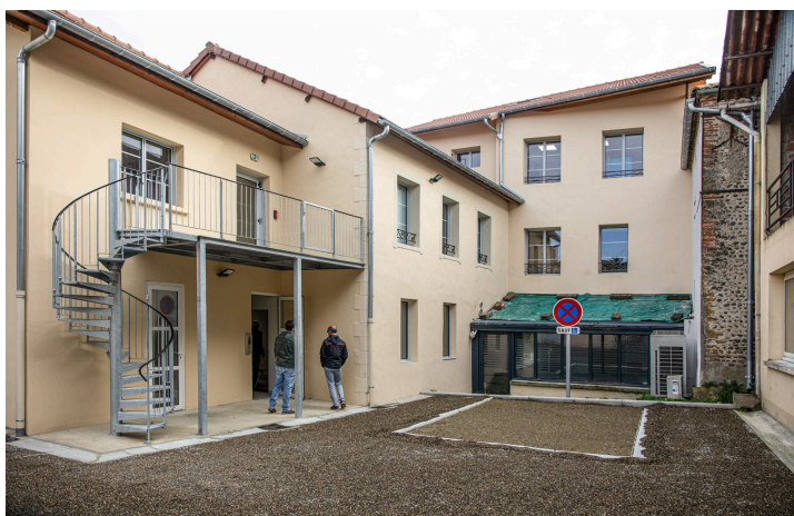
...Et une cour intérieure