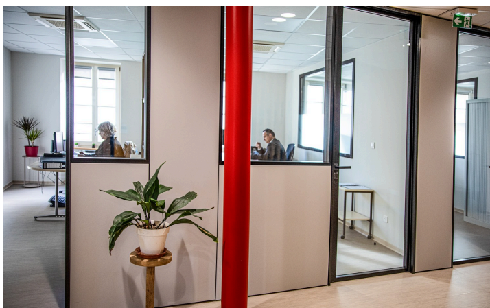
Bureaux de Cerfrance au 1er étage