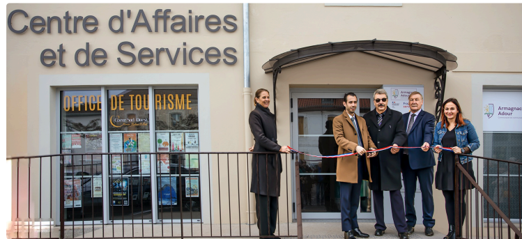
Riscle : inauguration du Centre d'affaires et de services « Hôtel Caupenne »