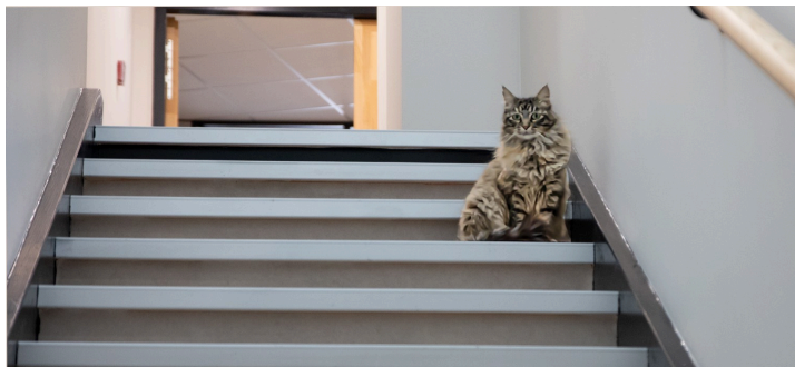
Un hôte de marque du Centre d'affaires et de services