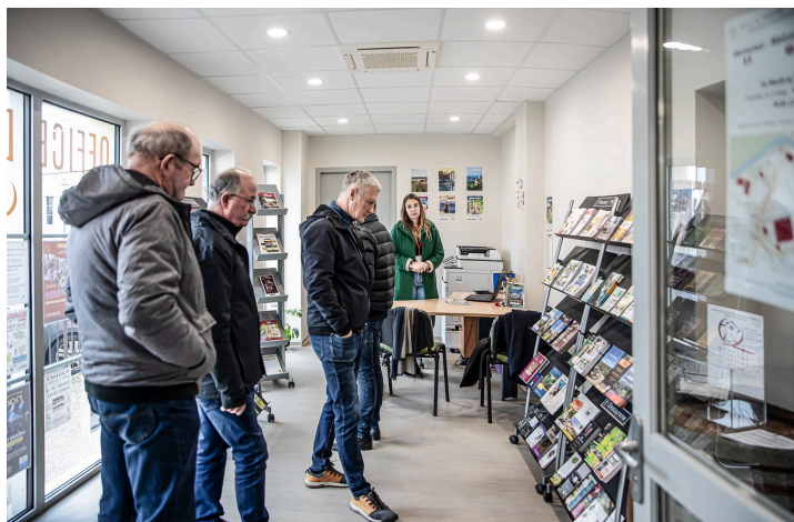
L'Office de tourisme