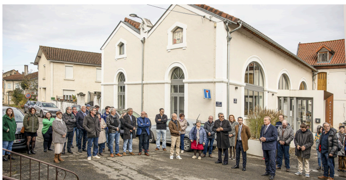
L'inauguration va commencer