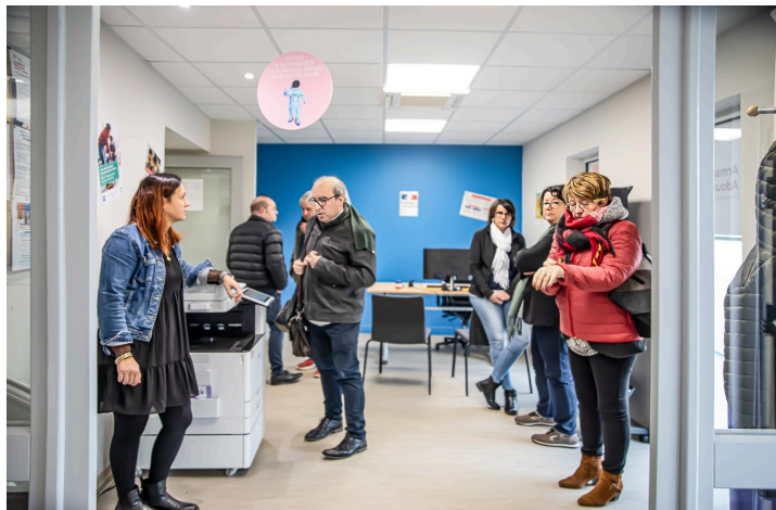
Autre vue de la Maison France services