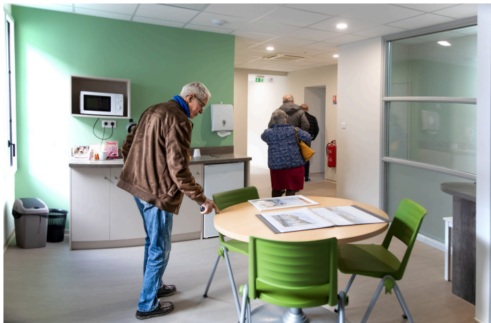
Bureaux au 1er étage