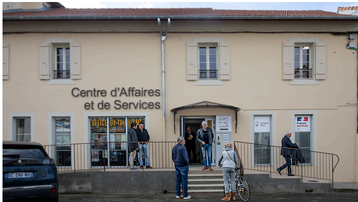
Vue de l'hôtel Caupenne, Centre d'affaires et de services