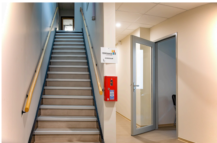
Escalier pour le 1er étage