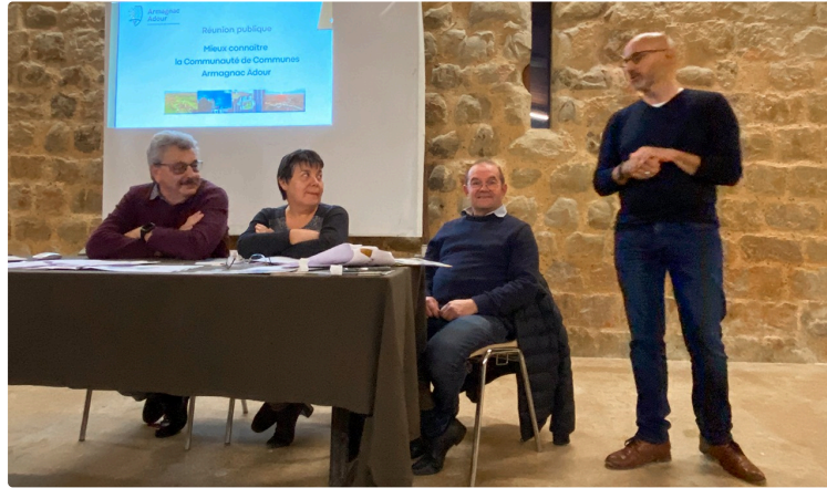
Communauté de communes Armagnac Adour, réunion publique à Termes d'Armagnac