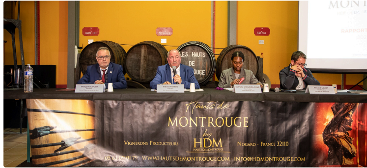
Nogaro : le coup de gueule du président des Hauts de Montrouge

Désorganisation du système d'assurance, frein aux prêts Agilor s'ajoutent à une 4e année catastrophique