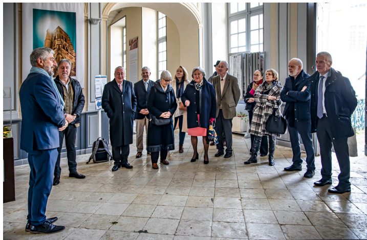
Le maire raconte Lectoure à ses hôtes