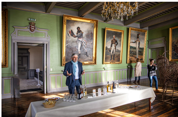
Le maire fait les honneurs des magnifiques salles de la mairie