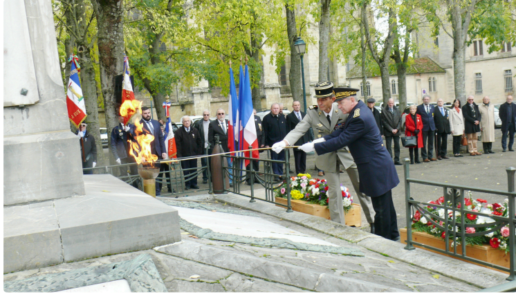
Hommage aux "Morts pour la France" pendant la guerre d'Algérie et pendant les combats du Maroc et de la Tunisie