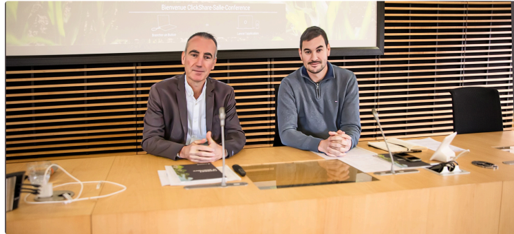
Risclé : Vivadour résilient malgré les aléas climatiques et géopolitiques