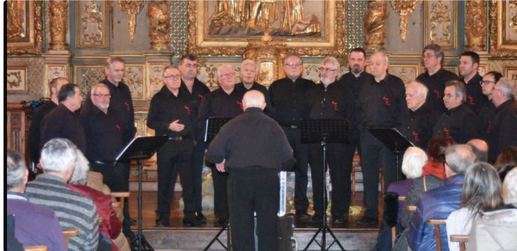
Vaya Con Dios en concert