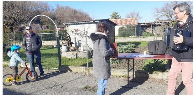
Animation sur le Marché de Pavie

C'est sur la petite place du marché, derrière la médiathèque, que la matinée a commencé à Pavie ce mercredi 18 décembre.