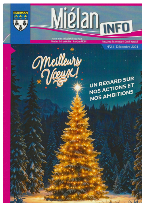
Miélan Info 2 6 Dec 2024.jpg

Enfin, un appel au recrutement de sapeurs-pompiers volontaires pour que le centre de secours et d'incendie de Miélan perdure et garantisse l'efficacité de ses interventions, occupe les deux dernières pages.